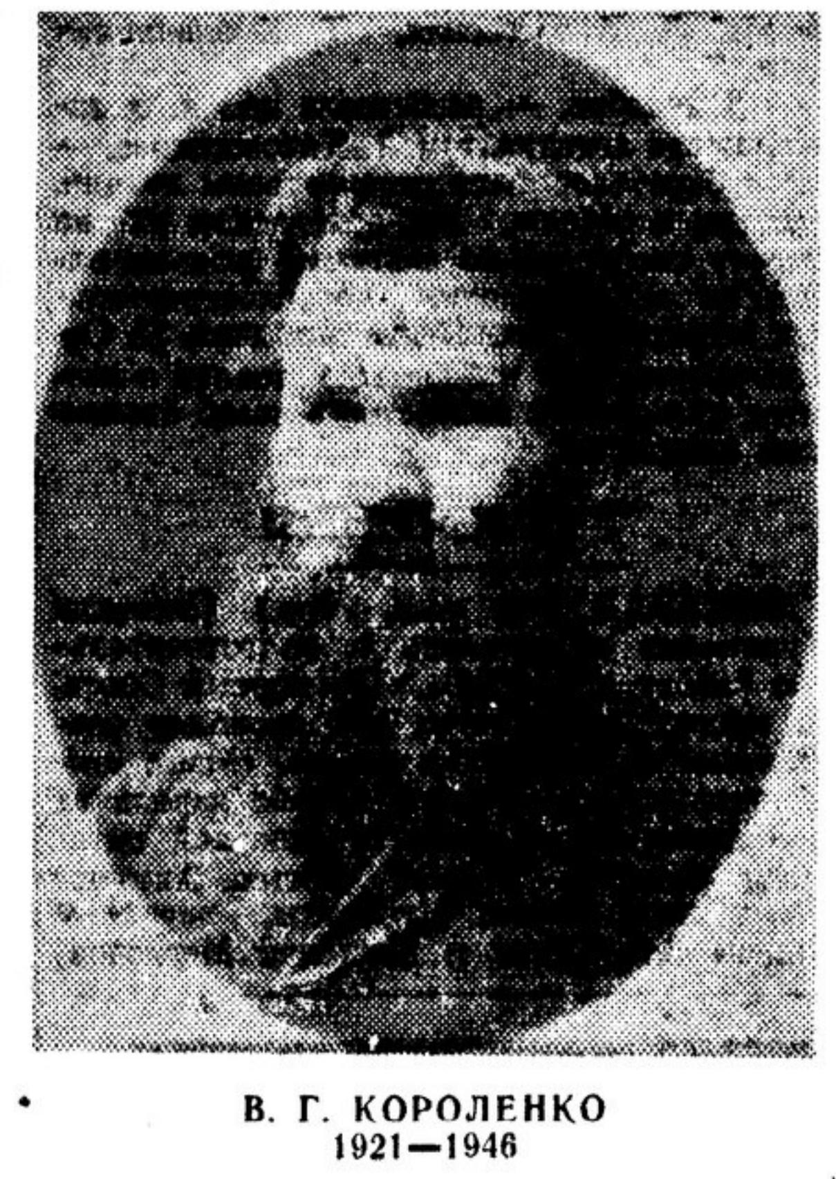
В. Г. КОРОЛЕНКО 1921—1946