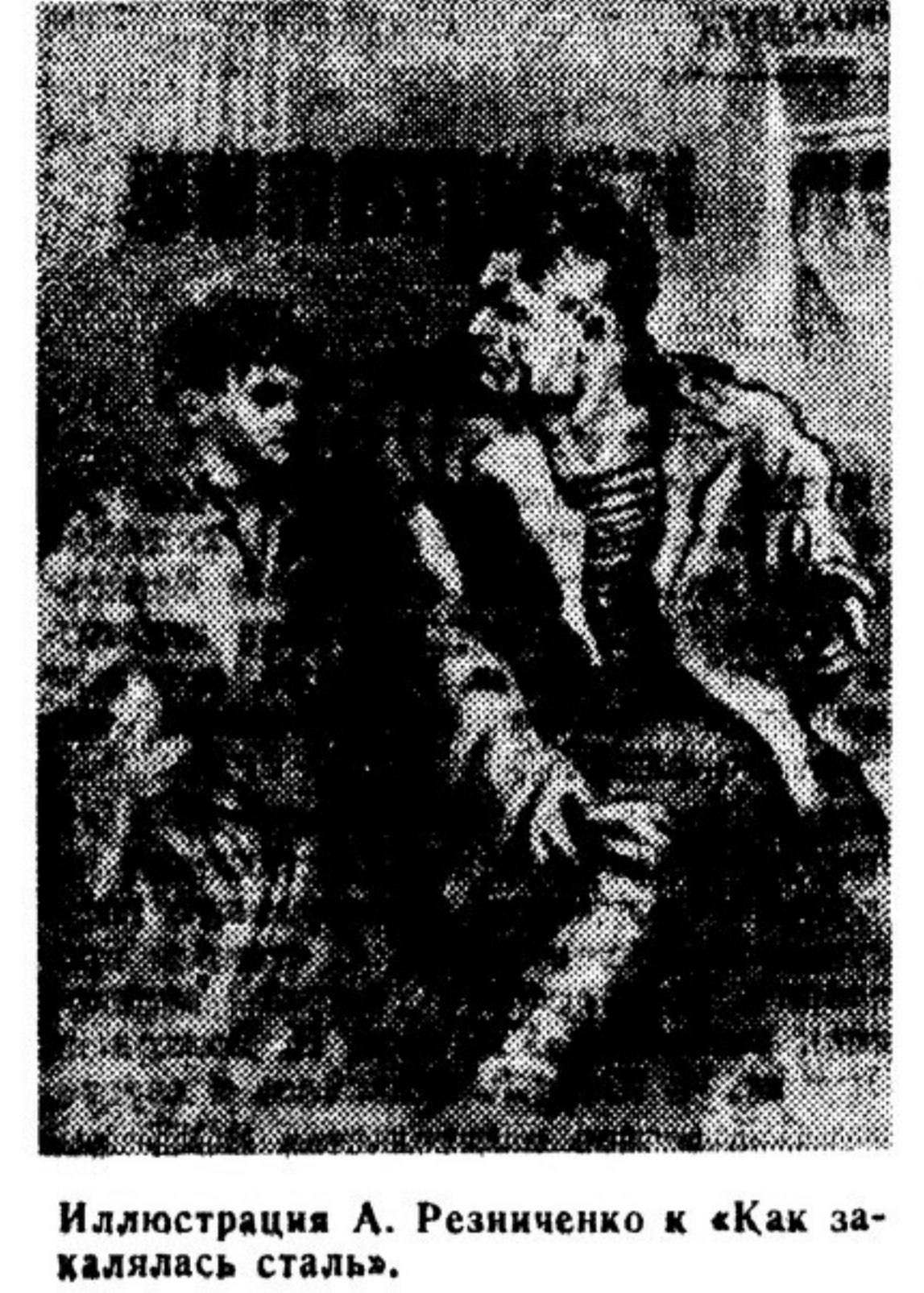
Иллюстрация А. Резниченко к «Как закалялась сталь».