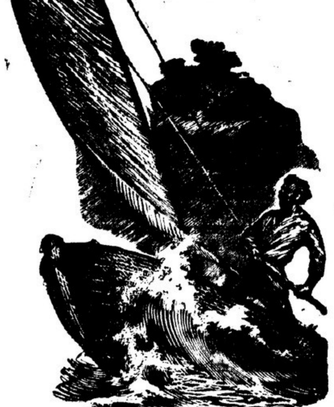
ЛЕС ШУМИТ МГНОВЕНИЕ

Обложка книги В. Короленко работы Ю. Ростова (Гослитиздат).